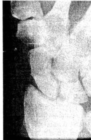
Slika 1: Svež zlom čolnička prečno v srednji tretjini. Na standardnem PA posnetku je komaj viden.

opaziti posredni znak – nepravilnost kostnih trabekul, napravimo tomografijo zapestja. Idealne projekcije za prikaz čolnička s klasično rtg tehniko namreč ni, čeprav so jih opisali kar 18. Tomografija je lahko navadna, trispiralna, ali računalniška. CT pride v poštev izjemoma, predvsem tedaj, ko na podlagi predhodnih standardnih posnetkov sumimo, da gre za obsežno, kompleksno poškodbo zapestja. Nekateri avtorji priporočajo izjemoma tudi uporabo scintigrafije, s katero ugotovimo prisotnost ali odsotnost povečane presnove v čolničku, vendar je zaradi majhne specifičnosti ta metode nezanesljiva in je pri nas nismo uporabljali. Poleg poškodbe čolnička moramo biti pri odčitavanju rentgenskih posnetkov pozorni tudi na znamenja nestabilnosti zapestja, posebej na DISI (dorsal intercalated segment instability), VISI (volar intercalated segment instability) ter skafolunatno disociacijo.