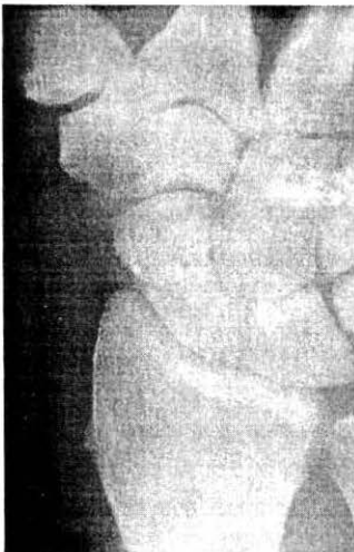
Slika 2: Isti primer, tokrat posnet z nagibom rentgenske cevi za cca 35°. Ker potekajo žarki bolj vzporeno s prelomno črto, je zlom očitnejši.