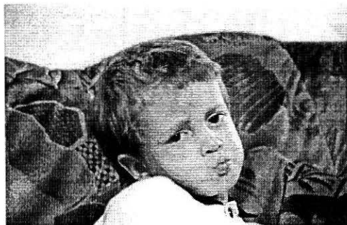
Slika 2: Igrivost