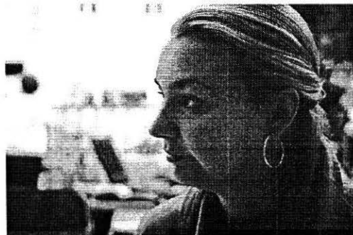
Slika 5: Jera