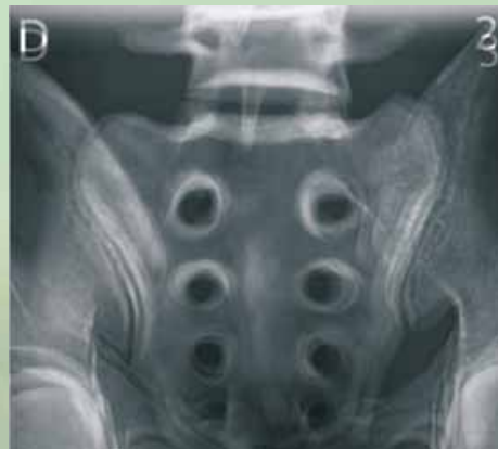
Slika 4: Prikaz povečave slike v PA projekciji (Mekiš, 2009).

kotih pomeni razliko v prejeti dozi ionizirajočega sevanja. Za optimalne ekspozicijske pogoje smo upoštevali Evropska priporočila (European commission, 1996), ki določajo merila