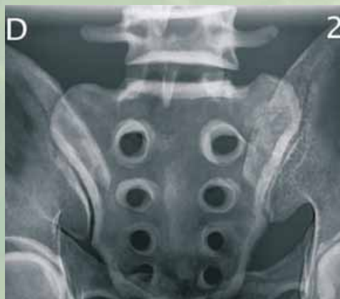
Slika 2: Rentgenska slika SIS v AP projekciji (Mekiš, 2009).

Optimalni kot smo v AP projekciji dosegli pri 20° v kranialni smeri, kar v svoji študiji navajajo tudi Jurik et al. (2002); v PA projekciji pa je optimalni kot znašal 12° v kaudalni smeri. Sliki 2 in 3 prikazujeta skoraj identično prikazane SIS v odnosu s sramnico, kar je primerno za ocenjevanje kvalitete rentgenogramov. Potrebno pa je upoštevati, da razlika v