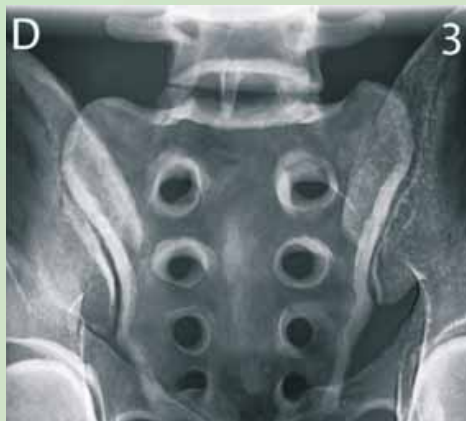
Slika 3: Rentgenska slika SIS v PA projekciji (Mekiš, 2009).