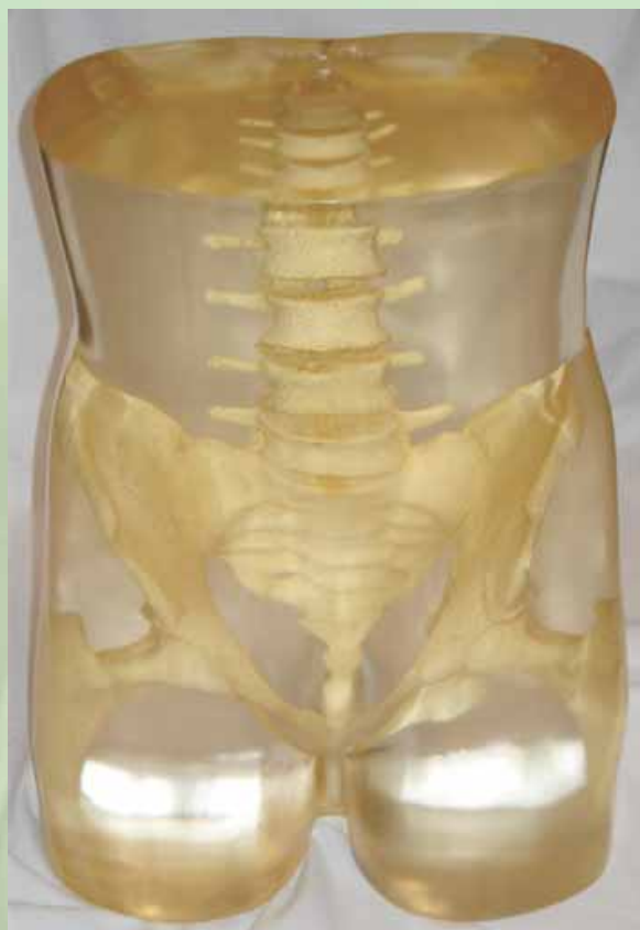
Slika 1: Fantom uporabljen pri študiji (Mekiš, 2009).

Za pravilno nastavitev centralnega žarka glede na anatomske odnose v fantomu smo uporabili podatke iz